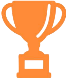
Логотип трека «Орлёнок – Спортсмен»

Ценности, значимые качества трека: здоровый образ жизни