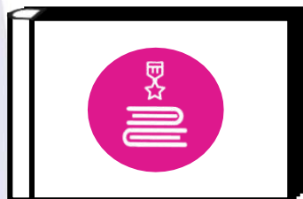
Альбом хранителя исторической памяти

Символ «альбом Хранителя» многозначен и достаточно ёмок в своём воплощении. Исходя из возможностей детского коллектива, уровня его сформированности и вовлеченности в коллективно-творческую деятельность, педагог вместе с детьми может придумать форму альбома Хранителя, где можно разместить историческую летопись класса, района, города и всей страны. Это могут быть переплетенные между собой чистые листы для рисунков, фотографий, открыток, объединённые общей тематикой и историей.