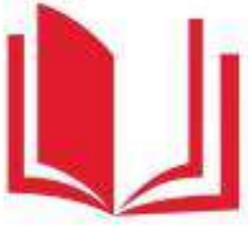
Логотип трека «Орлёнок – Эрудит»