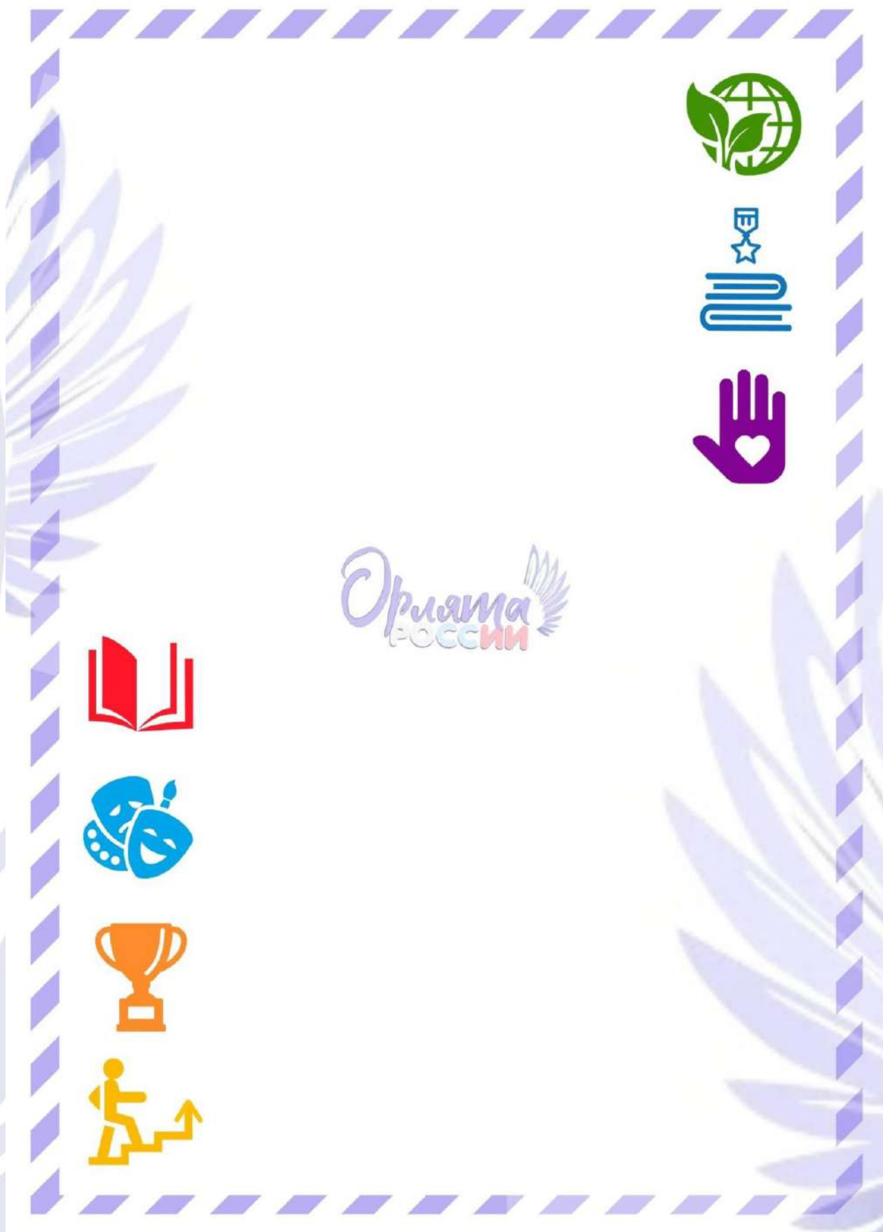
Рис. 2. Обратная сторона «Письма в Будущее».