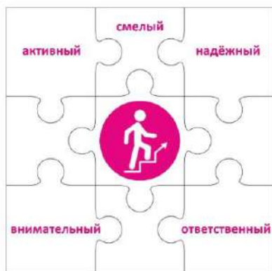
Конструктор «Лидер» 2 класс

Чтобы быть лидером, нужно много знать, уметь вести за собой, постоянно развиваться. Личность лидера многогранна, она словно складывается из множества разных пазлов, которые в целом дают яркую и интересную картинку. Конструктор «Лидер» представляет собой большой пазл, где центральный элемент – символ трека – человек, поднимающийся вверх по лестнице. Остальные части этого пазла – элементы небольшого размера, примерно формата, на каждом из которых в левом верхнем углу написаны по одной букве из алфавита.