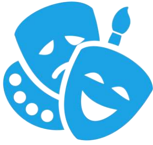
Логотип трека «Орлёнок – Мастер»