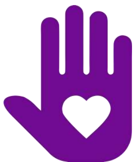
Логотип трека «Орлёнок – Доброволец»

Реализация трека проходит для ребят 1-х классов в начале декабря, но его тематика актуальна круглый год. Важно, как можно раньше познакомить обучающихся с понятиями «доброволец», «волонтёр», «волонтёрское движение». Рассказывая о тимуровском движении, в котором участвовали их бабушки и дедушки, показать преемственность традиций помощи и участия. В решении данных задач учителю поможет празднование в России 5 декабря Дня волонтёра.