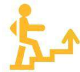
Логотип трека «Орлёнок – Лидер»

Ценности, значимые качества трека: дружба, команда