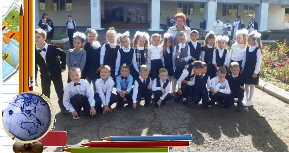
«ЛСЖК» № 1, сентябрь 2021